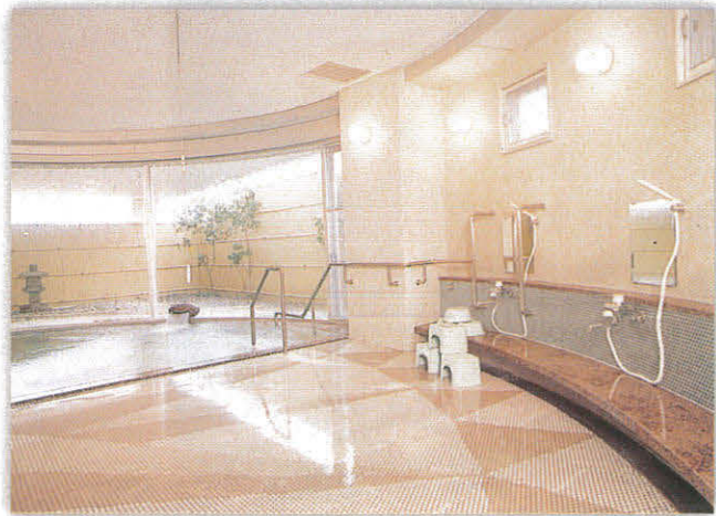
広びるゆったりの大浴場：炭酸ガス入りです。