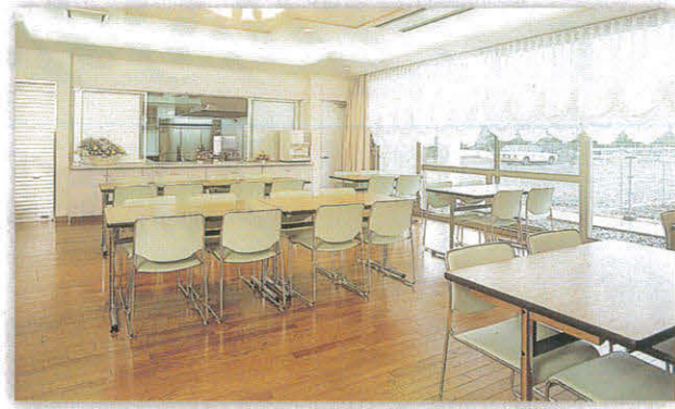
明るい食堂：キッチンとの対話ができるようになっています。

ここは自分を取りもどすための豊かなうるおいがいっぱい。 この恵まれた環境は住む人にかげがえのない充足の時をもたらすでしょう。