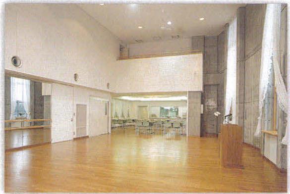
多目的ホール：前方食堂部と開閉可能